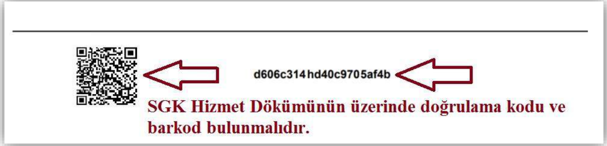
Resim 3- SGK Hizmet Dökümü örneği

suretiyle işçi statüsünde bilişim personeli olarak geçtiği belgelenen hizmet süreleri dikkate alınır. Mesleki tecrübe sürelerinde; başvuru pozisyon ile ilgili lisans mezuniyeti lisans mezuniyeti sonrasındaki hizmetler dikkate alınacaktır. Üzerinde doğrulama kodu ve barkod bulunan e-devletten alınan “SGK Hizmet Dökümü” mesleki tecrübeyi gösteren belge olarak kabul edilecektir.