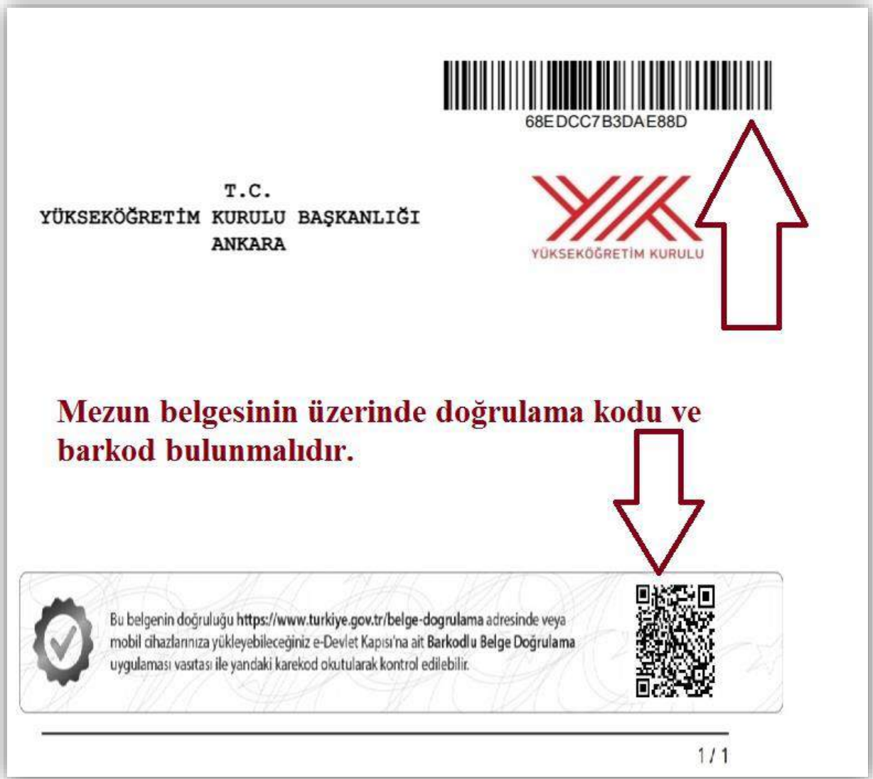
Resim 2- Mezun belgesi örneği

f) Diploma Denklik Belgesi: Eğitimini yurtdışında tamamlamış ya da yurtdışında bulunan üniversitelerden mezun olan adaylar diploma denklik belgesinin aslını veya aslına uygunluğu noterce onaylanmış örneğini ibraz etmelidir.